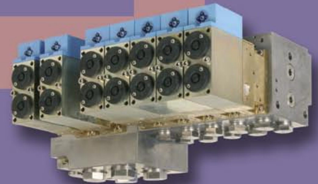
Регулировка воды и кондиционирование