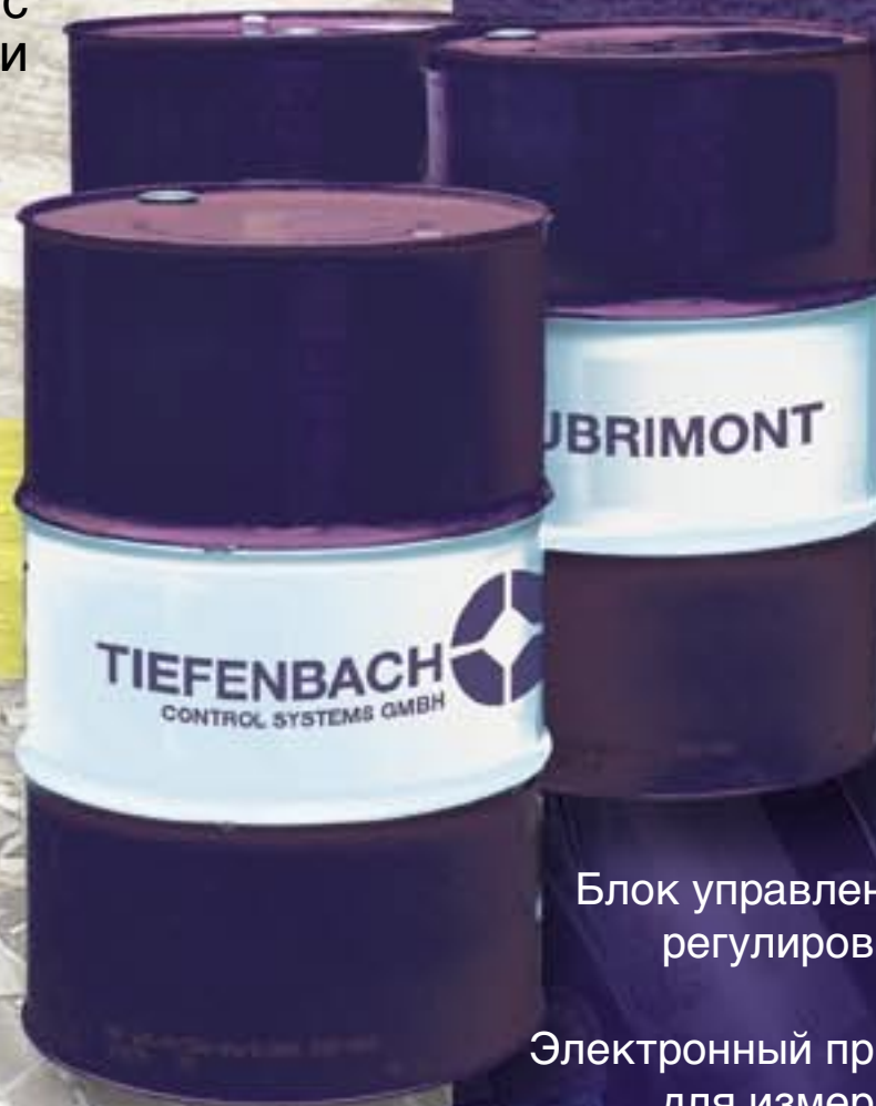
Бак концентрата HFA

Концентрат HFA, поставляемый в бочках с поверхности