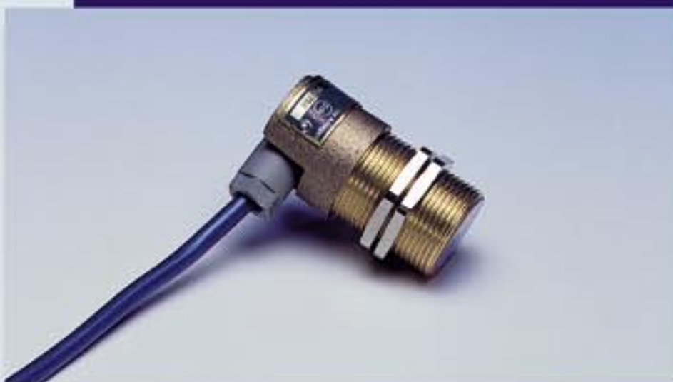
Датчик приближения объекта с разъёмом