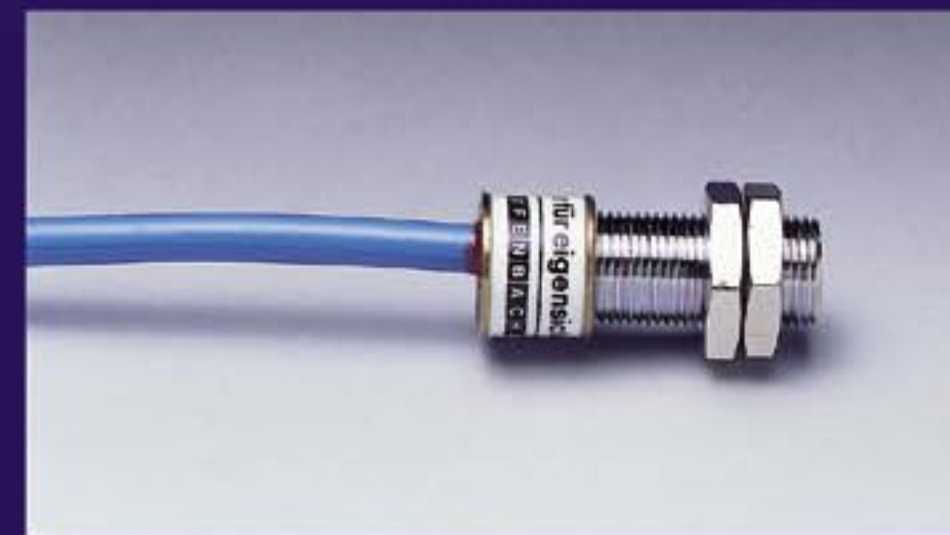
Датчик приближения объекта с соединительным проводом