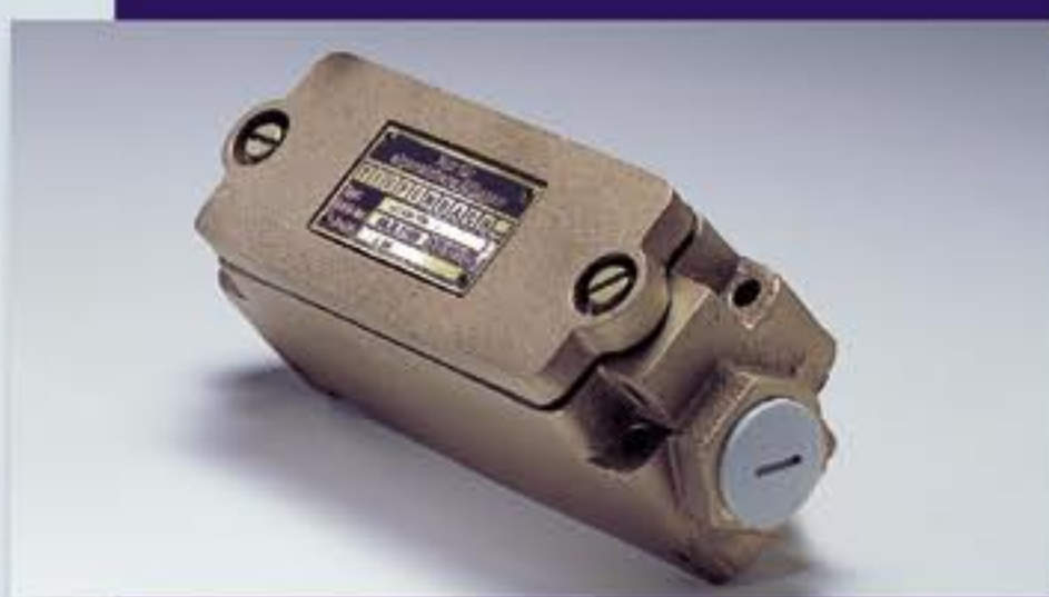
Магнитный переключатель с подсоединительным корпусом

будь то магнитный переключатель для управления и загрузки подъёмных клетей или датчик приближения объекта для контроля частоты вращения ленточного конвейера, или датчик уровня, производящий контроль наполнения резервуаров, либо клапаны приведения в действие стволовых дверей, вентиляционных дверей и бетономешалок с подачей в шахту.