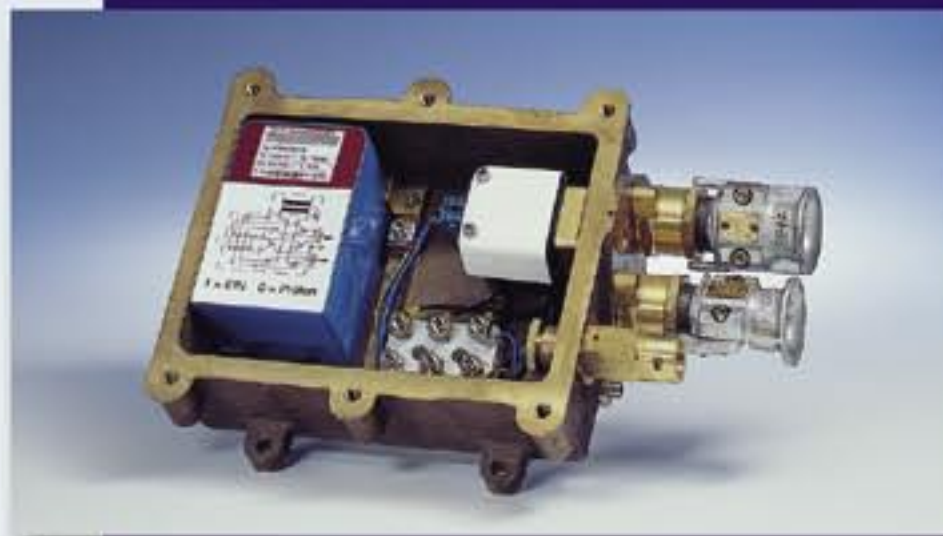
Блок питания с сетевым модулем