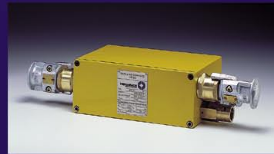
Блок питания блочного исполнения

Реле уровня и температуры с контактными выходами (слева)