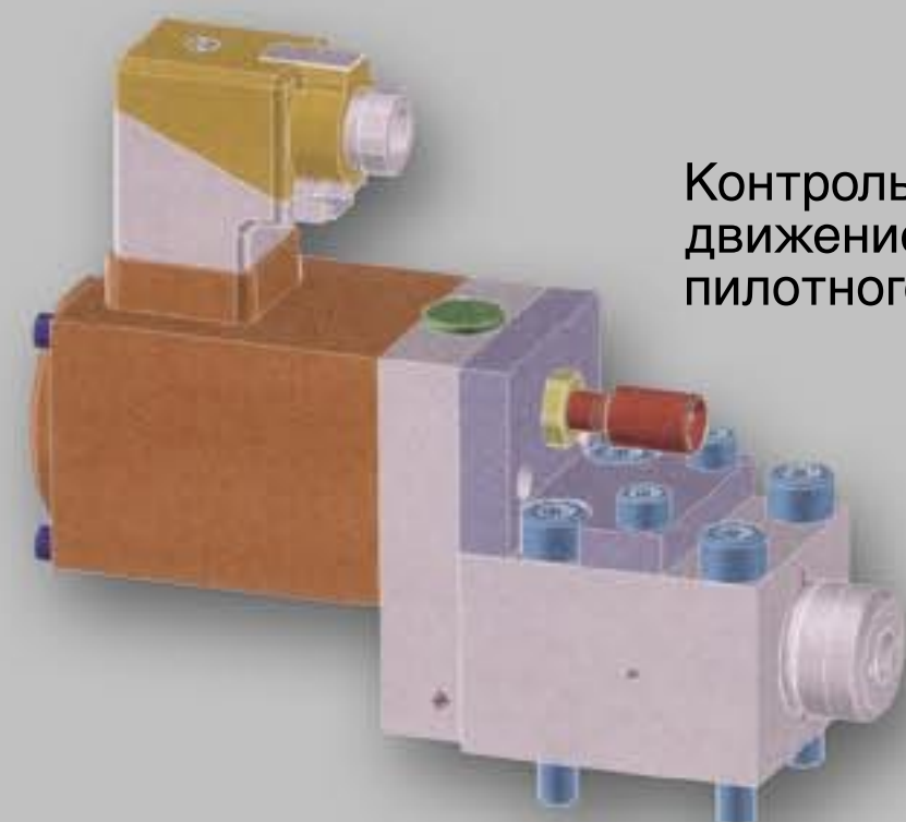
Контроль за движением толкателя пилотного клапана