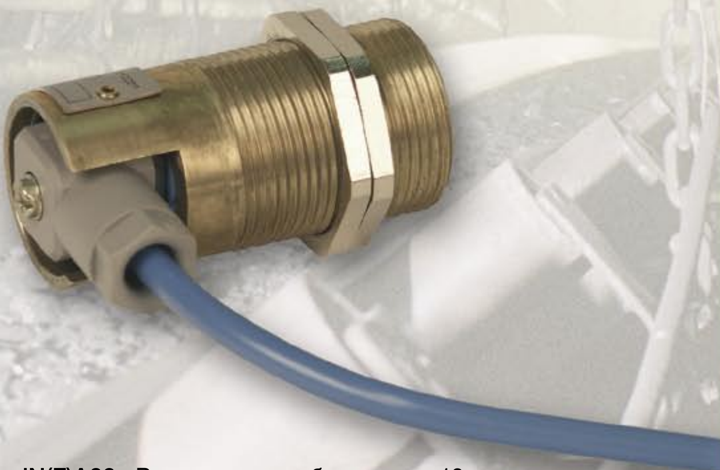
iN(F)A22 · Расстояние срабатывания 10 мм

Мы готовы предоставить Вам специальные исполнения датчиков с расстоянием срабатывания до 25 мм.