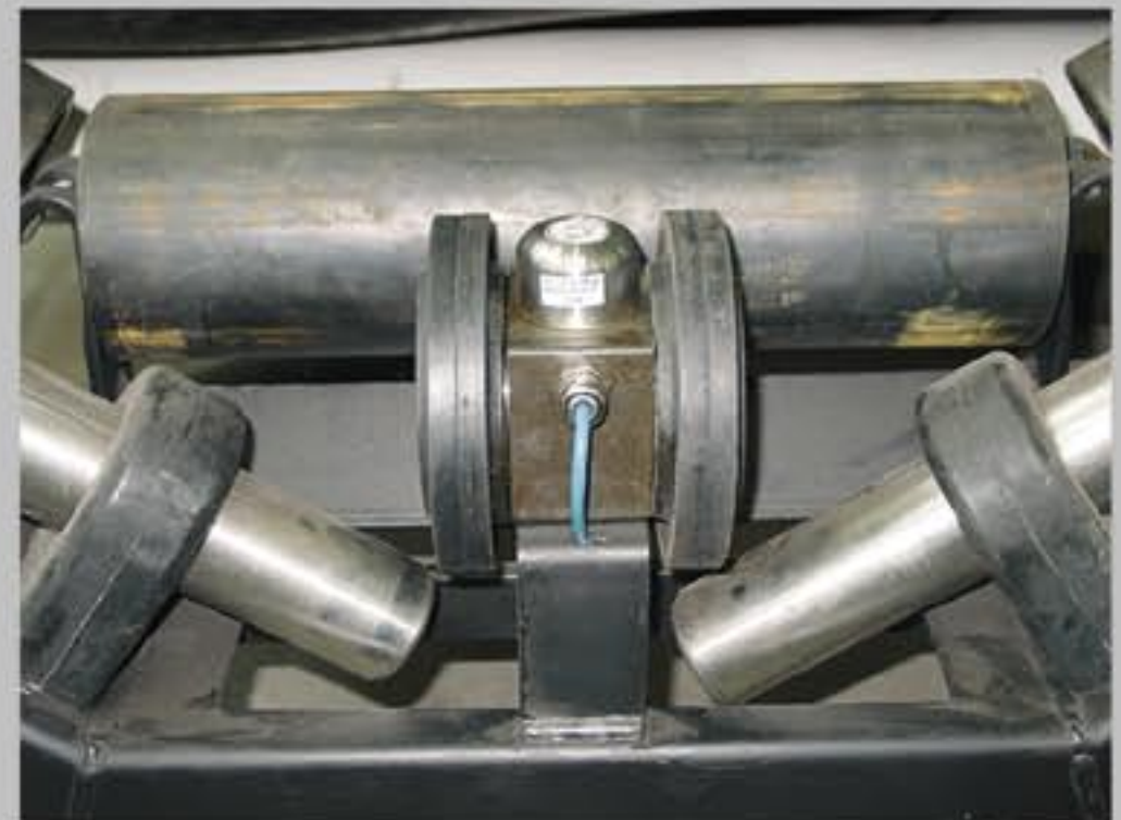
Контроль за движением конвейера