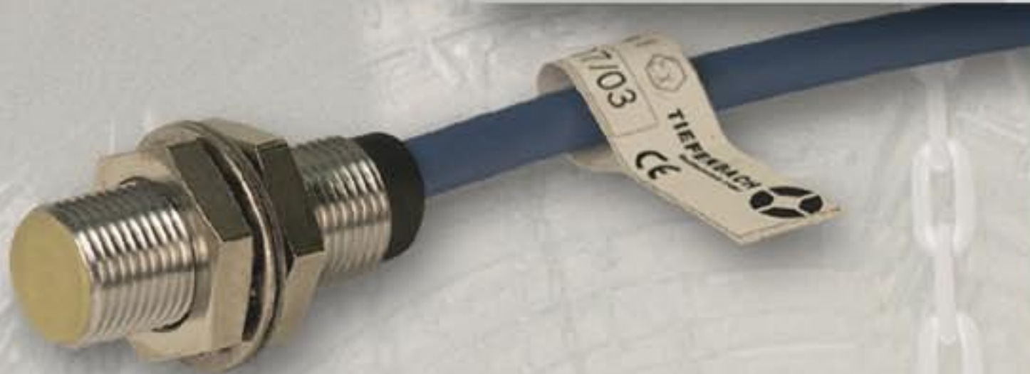
iNA05 · Расстояние срабатывания 1 мм