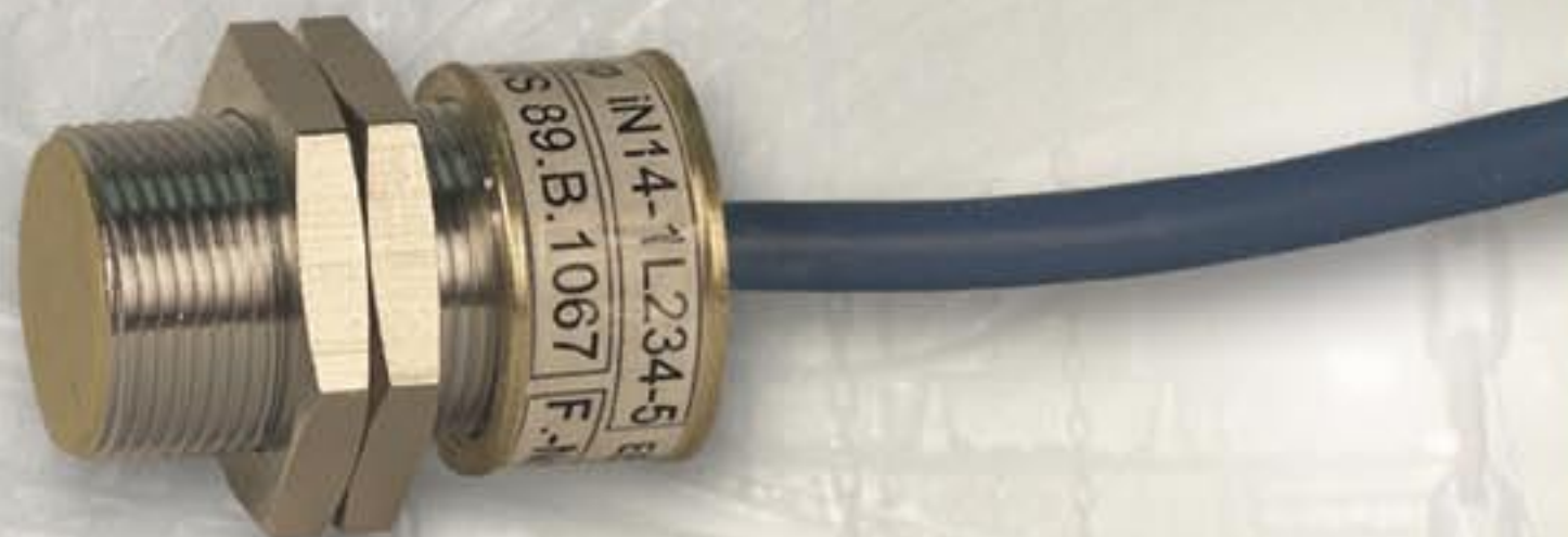
iNA14 · Расстояние срабатывания 5 мм